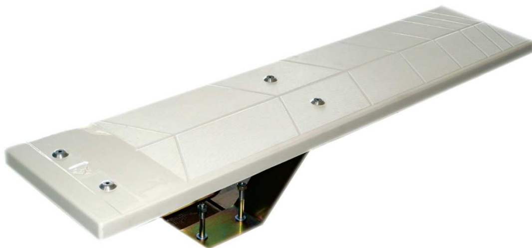
Trampolino in VTR mod. Ulisse cod. 1040505